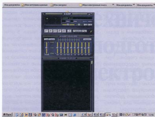
Рис. 1. Пример оформления электронного издания без указания выходных сведений на титульном листе

Характерной ошибкой при подготовке электронных учебных изданий является выпуск изданий без указания заглавия на этикетке носителя или отсутствие титульного экрана издания (рис. 1).